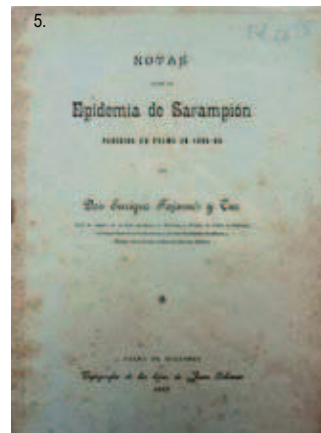
2. Desarrollo de la población de Calviá. Desde su origen hasta nuestros días –siglos XIII al XIX—. Biblioteca Fundación Bartolomé March / 3. Estudios sobre la historia de medicina en el Reino de Mallorca. Biblioteca Fundación Bartolomé March / 4. La Necrópolis de Palma. Biblioteca Fundación Bartolomé March / 5. Notas sobre la epidemia de sarampión padecida en Palma de Mallorca en 1895–96 Biblioteca Fundación Bartolomé March.

signat diputat provincial, càrrec que abandonà el 1928. Morí a Eivissa el 1934, deixant inèdita una Historia del Correo en las Islas Baleares .