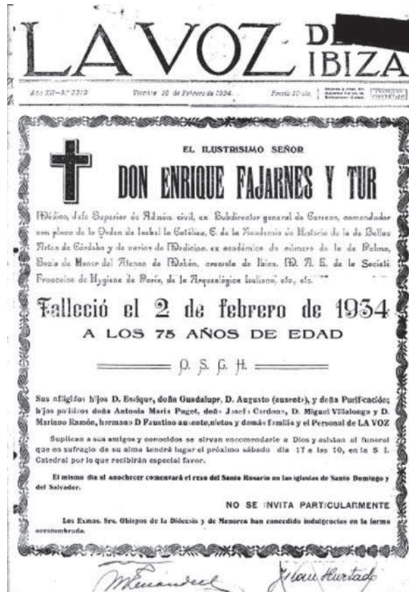
Esquela d'Enric Fajarnés i Tur. La Voz de Ibiza, 10 de febrer de 1934.

Aquesta exposició s'emmarca dins els actes de l'any dedicat a Fajarnés per celebrar el 150è aniversari del seu naixement, i podrà ser visitada en pròximes ocasions a Barcelona, Eivissa i Maó, on es traslladarà al llarg de l'any 2009.